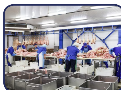
Plantas de procesamiento de alimentos